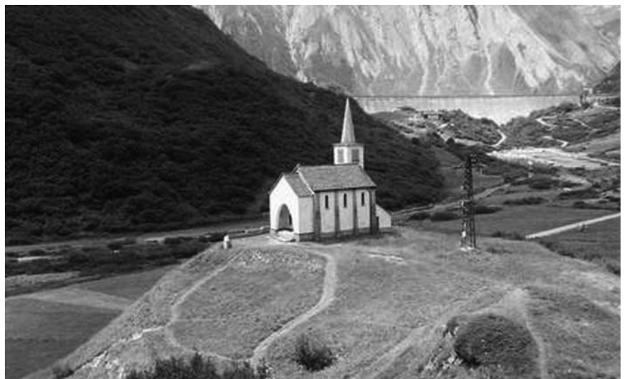
CHIESA DI RIALE

“ tutelare e valorizzare i beni di uso civico quali elementi fondamentali per la vita e per lo sviluppo delle popolazioni rurali e quali strumenti primari per la salvaguardia ambientale e culturale del patrimonio e del paesaggio agro-silvo-pastorale trentino ”.