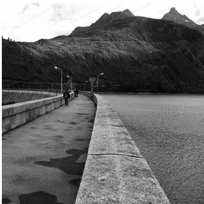
DIGA DI MORASCO

Per un futuro, almeno in piccola parte, all'altezza di un così illustre passato.