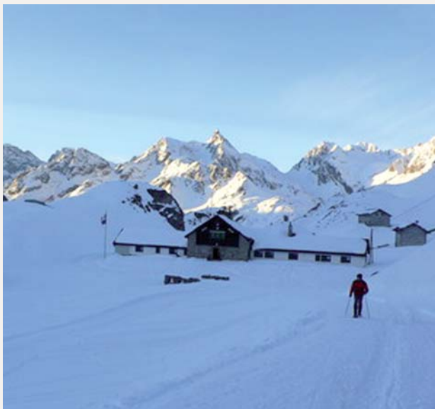
RIFUGIO MARIA LUISA ALTA VAL FORMAZZA