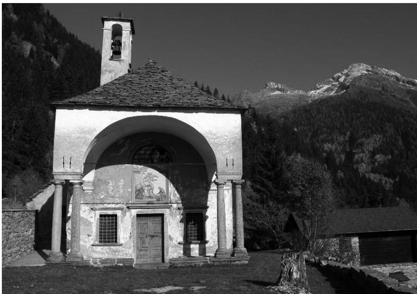
CHIESETTA DI ANTILLONE

La frazione di Capraga fa parte del Comune di Vogogna, non del Comune di Premosello Chiovenda come riportato erroneamente su Geoide n. 3/2011